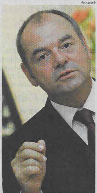
Leo Hohla: Das Angebot ist gut, die Nachfrage sinkt

IMMOBILIEN Geschäft mit Ferienwohnungen läuft wieder normal