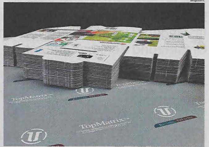
Bieling & Petsche hat sich im Stanzvorgang von Wellpappe ein zweites Standbein aufgebaut

Basierend auf einer engen und erfolgreichen Zusammenarbeit mit international agierenden Konzernen, sind Produktionsübernahmen von deren Töchterwerken in Slowenien und in Rumänien geplant.